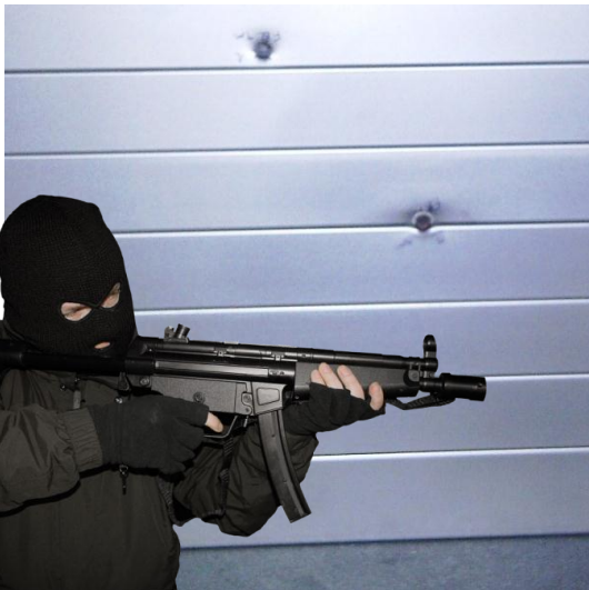
Perfil ANTI BALA de 50 mm de altura. Nivel FB4-S