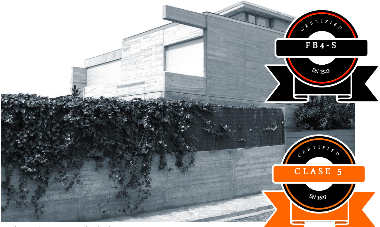
Mod. DIAMOND BL en Anodizado Plata Mate