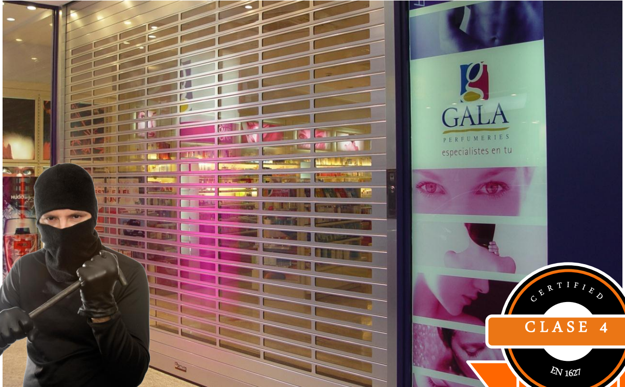
Mod. SECURBAIX BL VISION XL en Anodizado Plata Mate