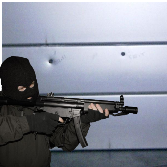
Perfil ANTI BALA de 100 mm de altura. Nivel FB6-S