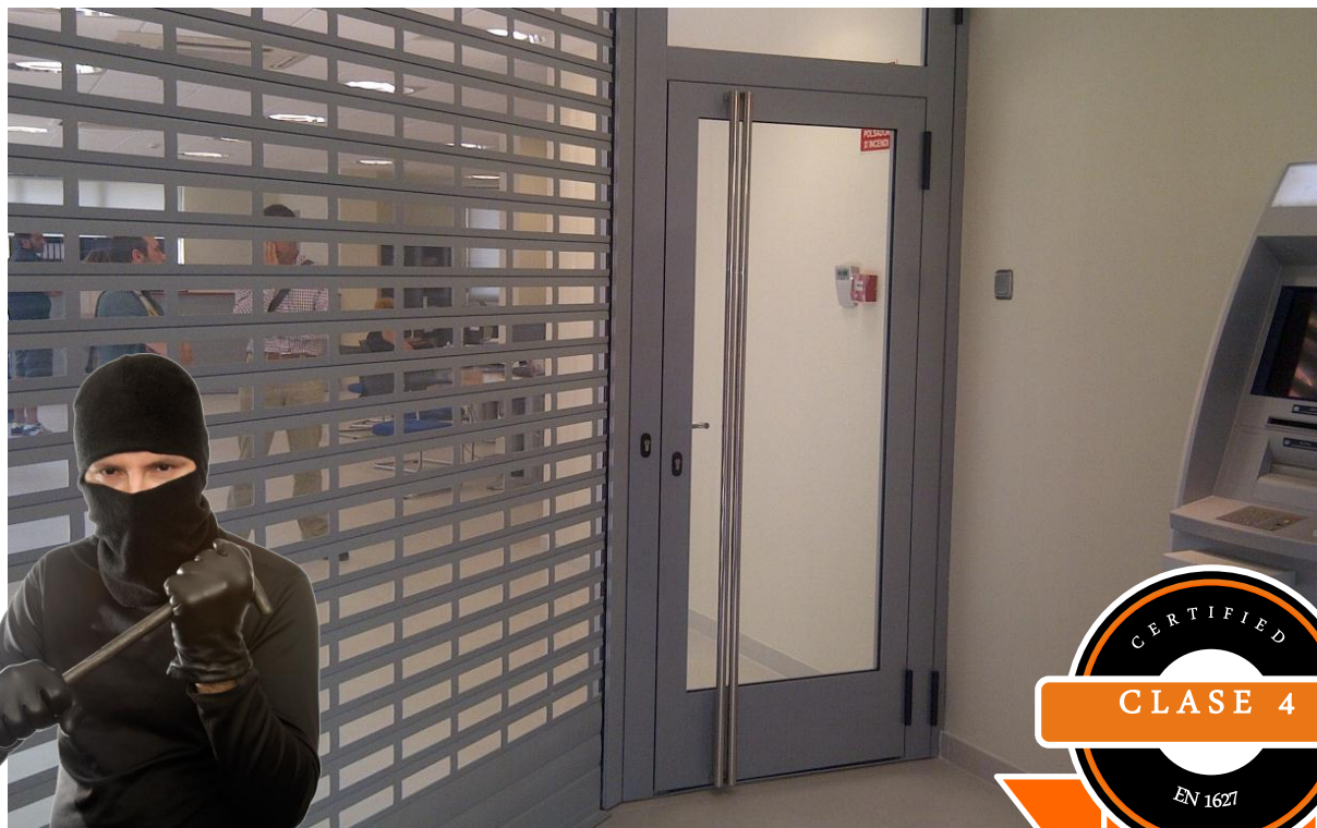
Mod. SECURBAIX BL VISION en una oficina bancaria